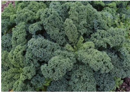
November - März