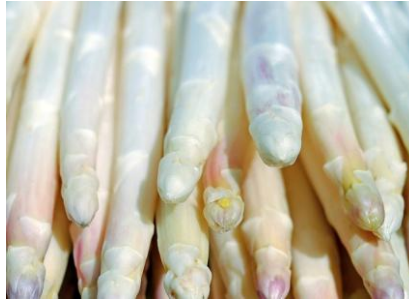
April - Juni