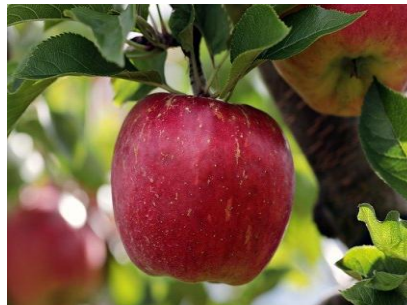
August - November