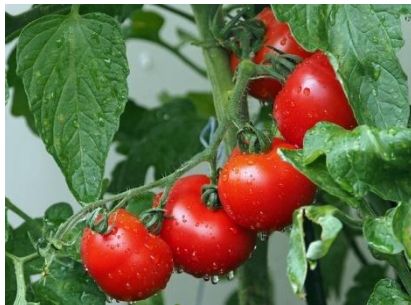
Juli - September