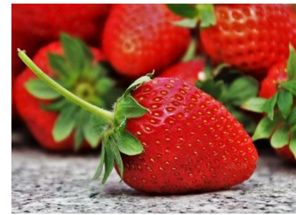
Juni - August