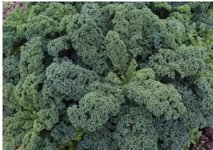
November - März