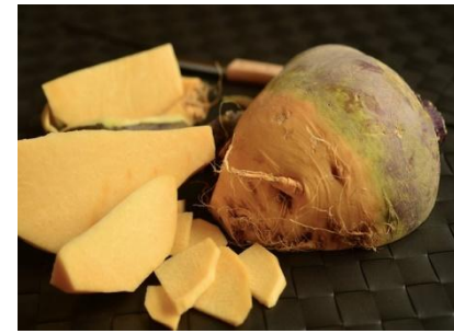
September - Dezember